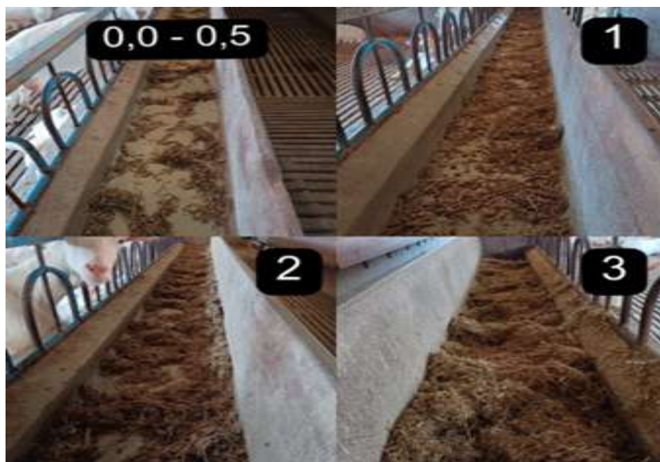
Imagem 05: Escala da leitura de cocho realizada durante o estágio na Capriana

De modo prático, a leitura é realizada através da seguinte forma, representado a seguir (Quadro 12), e ilustradas mediante as imagens retiradas da propriedade (Imagem 5)