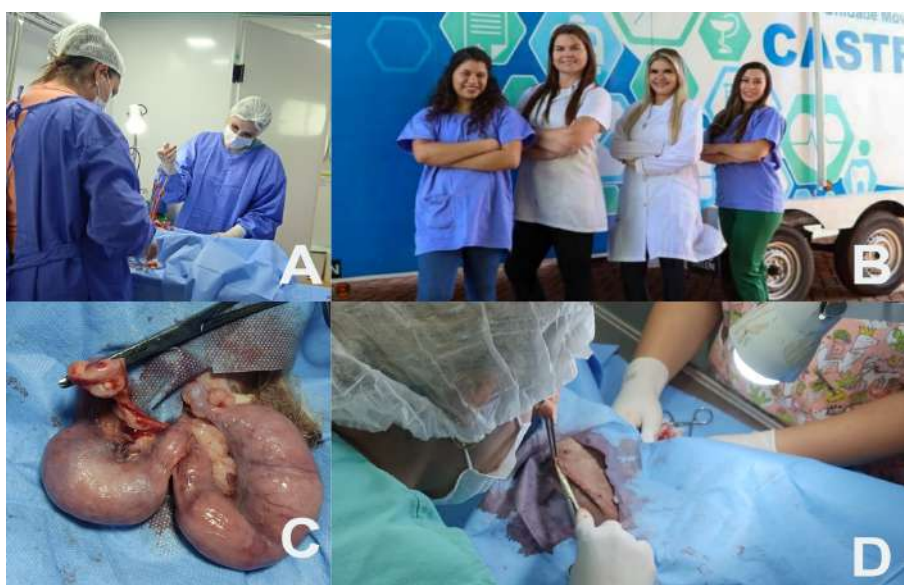
Imagem 01 - Atividades desenvolvidas durante o estágio na vigilância sanitária do município. (A) Realização de um procedimento cirúrgico de castração em fêmea Canina. (B) Formação da Equipe do Castramóvel. (C) Ovariosalpingohisterectomia com acometimento por piometra em fêmea canina. (D) Realização da incisão para realização do procedimento cirúrgico em fêmea canina.

As atividades desenvolvidas no estágio foram realizadas de segunda à sexta-feira, a partir das 08:00 horas da manhã, com saída às 11:30 e retorno das 13:00 até às 17:00. Em três dias da semana foram realizados no período matutino e vespertino, e em dois dias no período matutino. Um sábado foi utilizado como curso intensivo de castração.