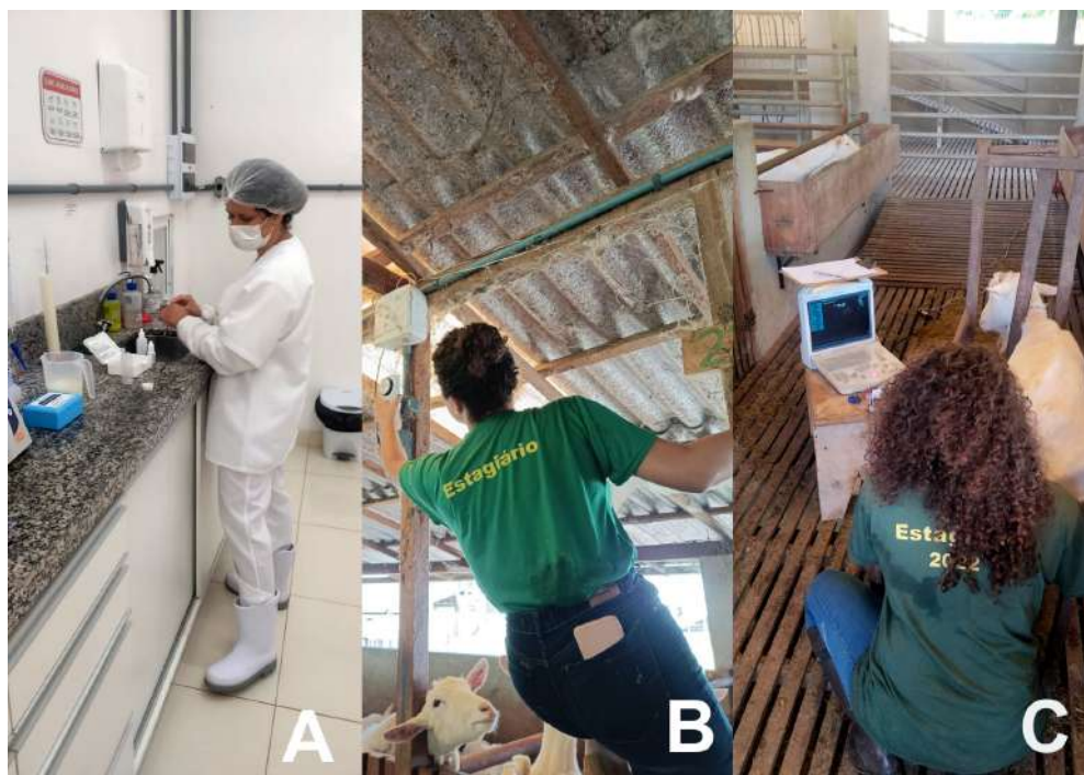
Imagem 03: Registro de diferentes atividades desenvolvidas na cadeia produtiva do leite caprino. (A) Realização do Teste de Fosfatase e Peroxidase do leite caprino. (B) Manutenção da instalação para efeito luz nas cabras vazias (C) Realização de avaliação ultrassonográfica em cabra prenhe.

zootécnicos, além da coleta de informações no programa de acompanhamento computacional da propriedade, para manutenção do rebanho.