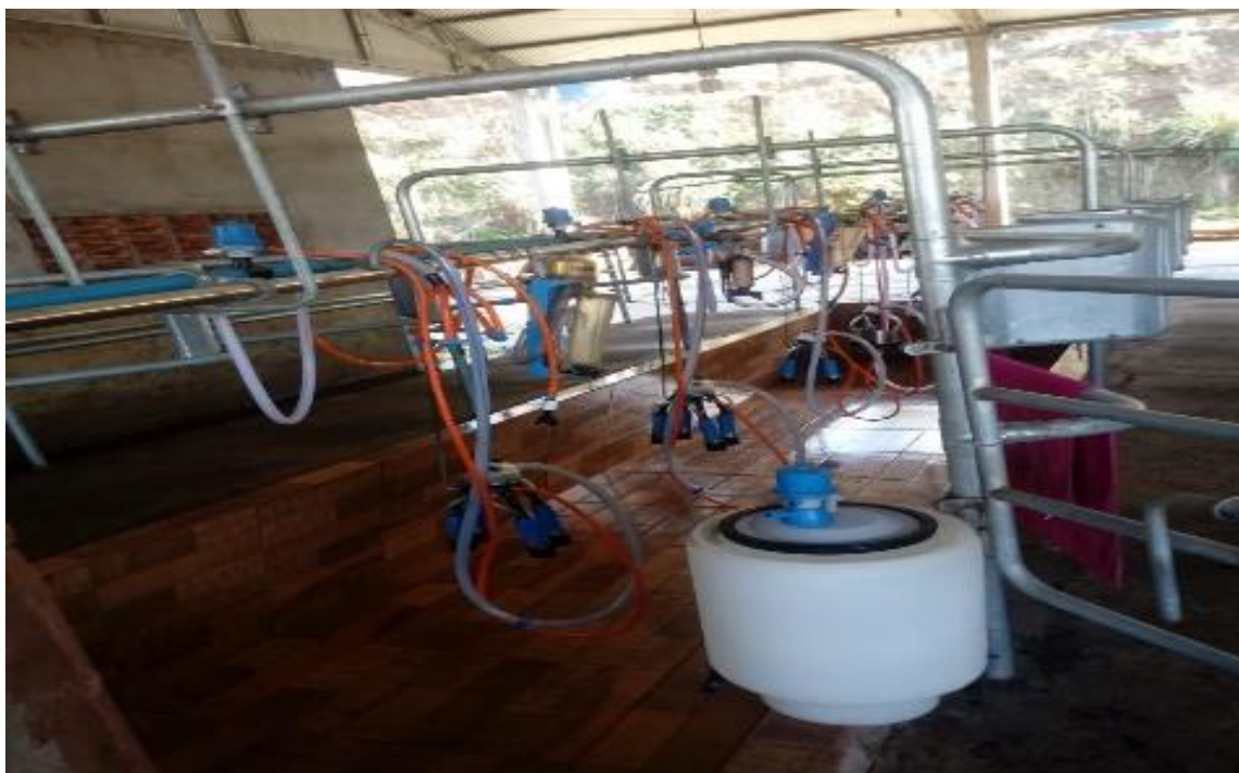
Figura 05 Sala de ordenha

A sala de ordenha dos animais tem capacidade de até 12 animais, sendo 6 animais cada lado, ela é classificada pelo modelo espinha de peixe, contendo fosso, onde o ordenhador permanece abaixo dos animais com seus equipamentos, esse modelo recebe essa denominação devido a seu desenho parecido com a estrutura óssea de um peixe.