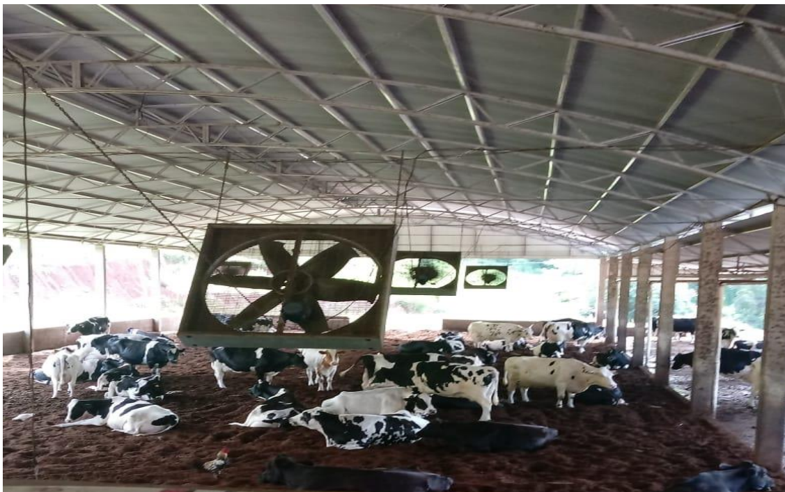
Figura 02- Sistema de Compost Barn

As figuras abaixo, mostram como é esse sistema, e nos dão uma visão clara da qualidade de bem estar que o sistema pode proporcionar.