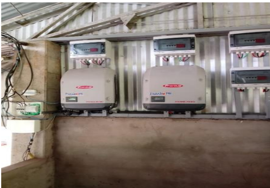
Figura 07 sistemas de controle de energia solar

energia com a energia elétrica da COPEL, fornecendo a quantidade que sobra de energia as torres da empresa.