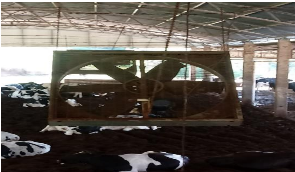
Figura 04- Ventiladores de ambiente

A propriedade conta com cerca de 06 ventiladores em volta do local para refrigerar o ambiente e manter a temperatura adequada necessária aos animais de produção.