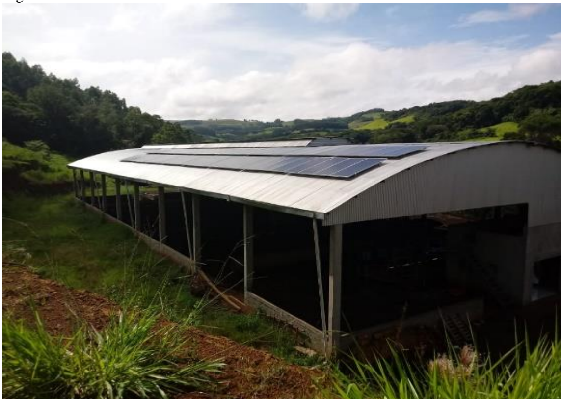
Figura 06 Placas Solares

A figura abaixo mostra o posicionamento das placas solares sobre o baracão em um dos pontos para captação e transformação da energia solar, que localiza-se do lado esquerdo, montado em sentido estratégico pela equipe de vendas do produto.