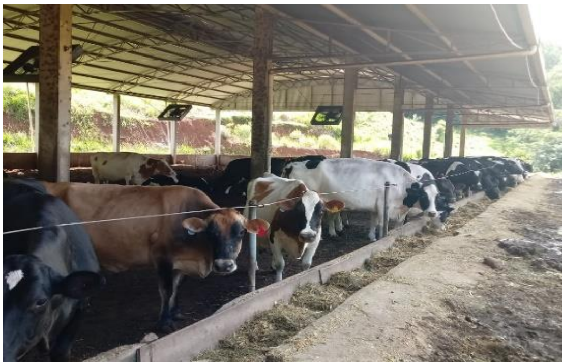
Figura 03 – Pista de alimentação